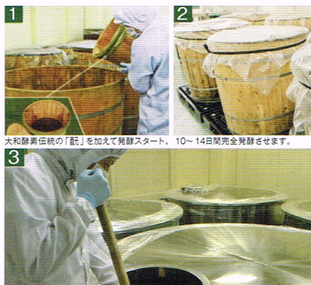
完全発酵後、2ヶ月~1年の「短期熟成」を行います。

弊社では長期の熟成はしていません。長期熟成をすると、多種類の植物原料由来の有効成分や、酵素、ビタミン、ミネラルなどが微生物の栄養として消費されてしまいます。結果として長く熟成されると微生物だけがたくさん残ってしまいます。また、微生物も歳をとりますので、フレッシュな微生物や酵素は期待できません。大和酵素では新鮮な酵素をお届けするため、最適な期間で熟成させています。